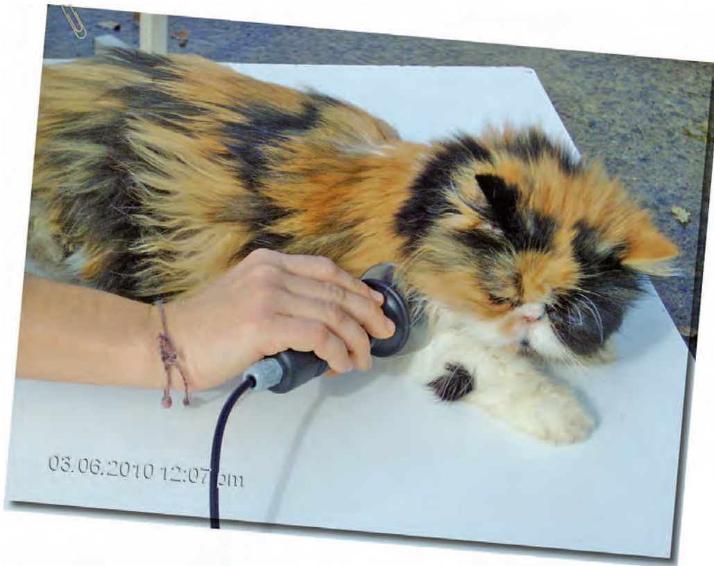
Fig.21 Incluso en el sector veterinario la diatermia puede ser utilizada con éxito para aliviar las molestias de nuestros pequeños amigos.

G. Bernabei – E. Pecchioli Aplicaciones prácticas de la utilización de la diatermia en las patologías de la rodilla Y Martina