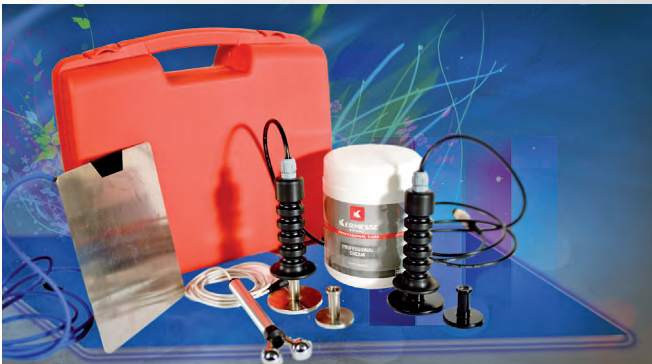
Fig.20 En la imagen se visualizan los electrodos utilizados en las diversas aplicaciones. A partir de la izquierda, el electrodo fijo, el electrodo resistivo para uso estético, después los electrodos móviles para uso fisiátrico, resistivo y capacitivo, disponibles en los dos tamaños 40 y 60mm.

También en este caso el electrodo móvil está disponible en dos diámetros diferentes, 40mm y 60mm , según la forma y las dimensiones de la zona a tratar.