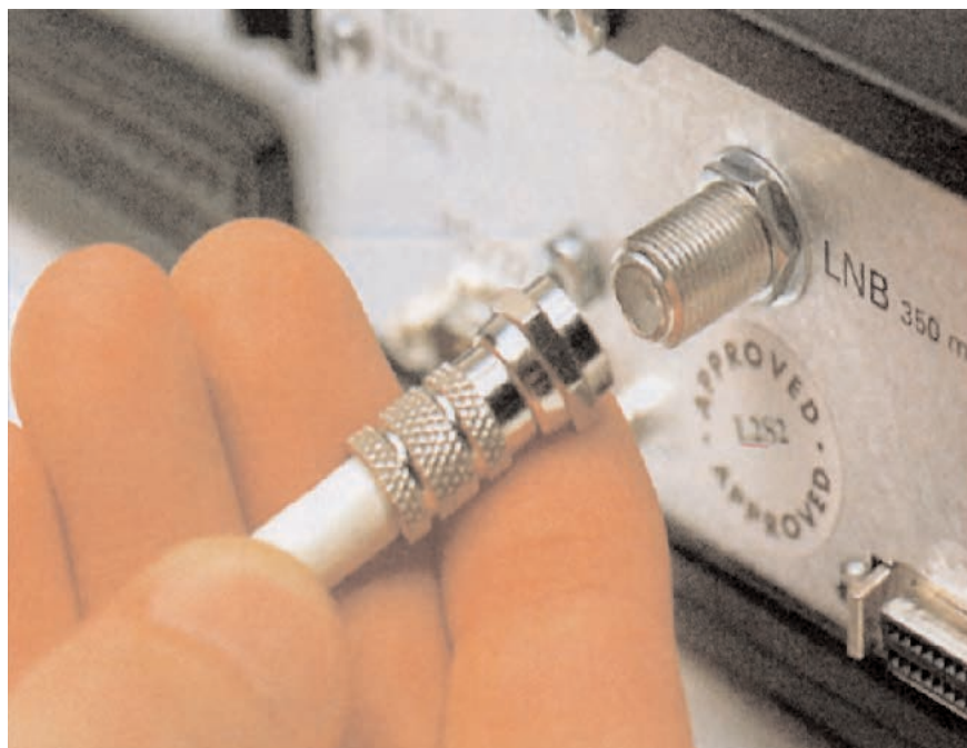
Fig.3 Una vez enchufado el conector F macho sobre el hembra hay que apretar la tuerca del conector macho para que la unión sea perfecta. Gracias a la utilización de conectores tipo F se reducen las atenuaciones de la señal UHF a unos 3 dB.