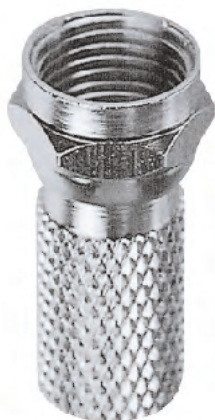
Fig.1 Como se puede observar en esta imagen un conector macho tipo "F" consiste en un pequeño cilindro metálico con la parte superior más ancha y que incluye una tuerca para enroscarlo al conector hembra presente en los convertidores LNB y en los decodificadores (ver Fig.3).

El conector macho tipo "F" se aplica directamente al cable coaxial siguiendo las indicaciones del texto del artículo y de la Fig.4. El precio de un conector macho tipo "F" está en torno a 1 €.